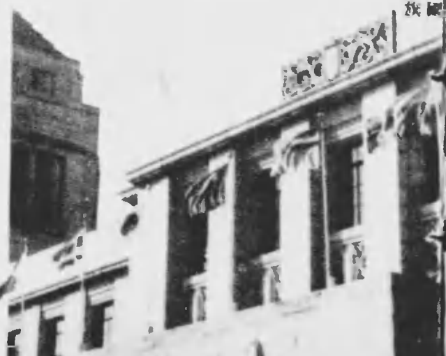
大東亞會議に於てられた帝國議事堂に對する參加國旗（右からビルマ國旗、暹羅國旗、中華民國國旗、日章旗、タイ國旗、フィリピン國旗、暹羅國旗）

東亞、否、世界の歴史に不滅の一頁を飾る大東亞會議の懷たる成果については、今さら多言を要しない。東亞一體の體平たる姿は、今や眼前に顯現せられ、しかも十億民衆の共同意志を大東亞戰爭完遂、大東亞建設必成の一點に結集し、以て世界平和の確立に寄與せんとする大東亞總動員、堂々の進軍は既に開始されたのである 十一月六日、會議第二日に發表された大東亞共同宣言は、東亞の戰爭目的と平和建設の理念を、剩すところなく世界に闡明した。東亞の創は、たゞ大東亞を發展化せんとする米英の非望を撃つのみであり、大東亞の建設は世界進運への貢獻を念願とする東亞はこの偉大なる意志を、實踐によつて、米英に思ひ知らせるのみである