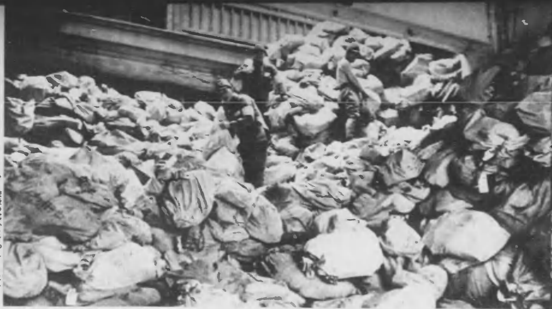
⇨ 銃後の真心をぎつしりと包みこんだ行儀は野戦郵便局に山と積まれた。係りの兵隊は今日も整理に汗をかいた。