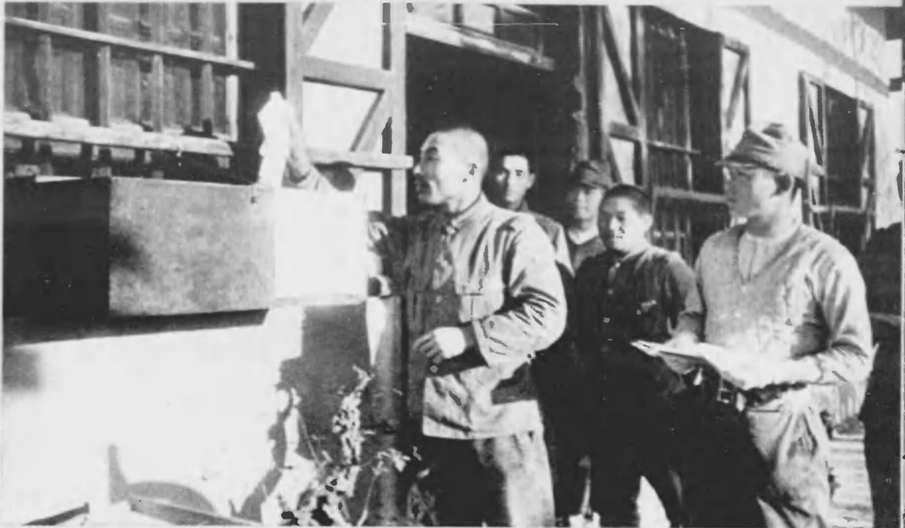
⇨ 当地警備の勇士たちも懐しい故郷への便りを野戦郵便局に投函する。日夜茶じてくれる父母への便りであらう。