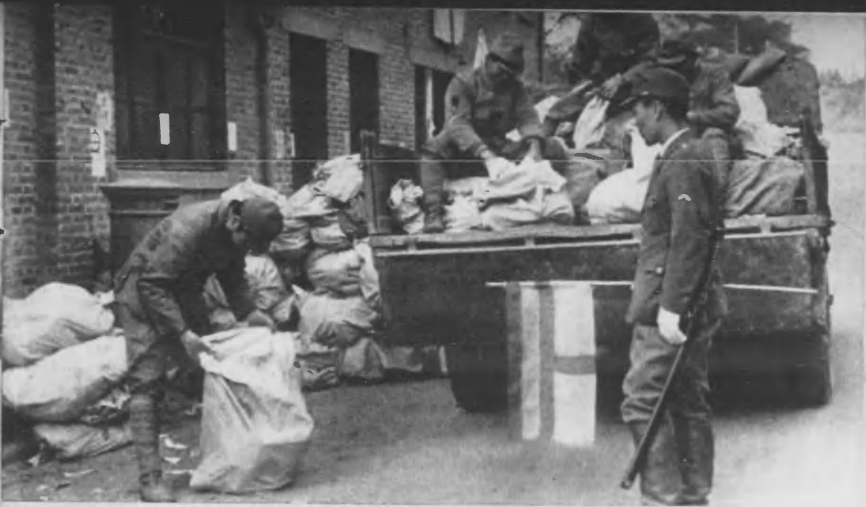
〇〇野戦郵便局に軍事郵便の行儀を満載したトラックが到着した。郵便局からは兵隊が数名とび出し、これも従軍郵便の係りの指圖に従って行儀を降し始めた。どつさりきたぞ。皆喜ぶだらう」と係りの兵隊はここに。