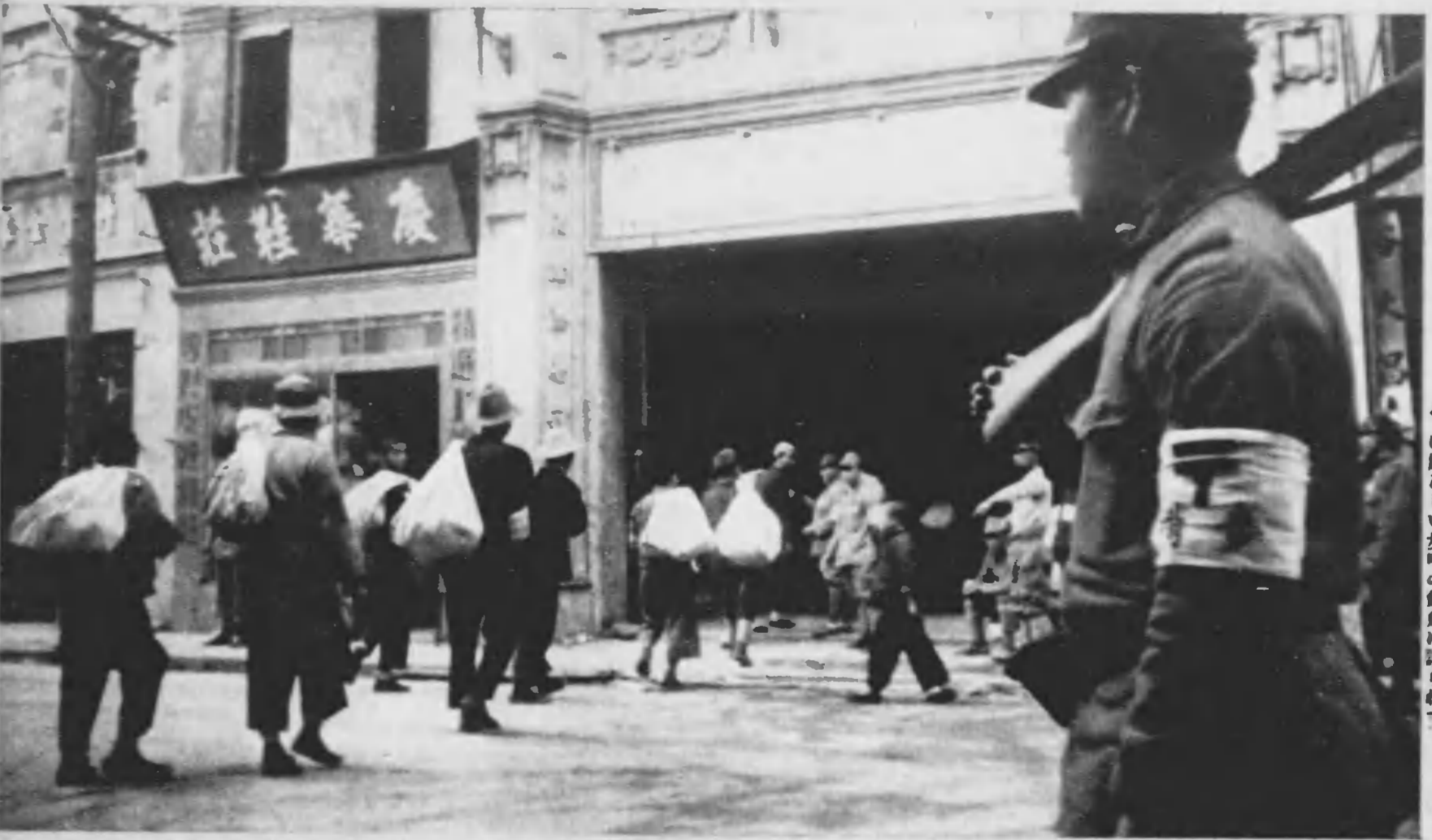
⇨ この野戦郵便局は塹壕に近いので、船で先行運ばざるが苦力に替わって埠頭から郵便局まで運ばせる。苦力の列は賑わしい歩哨の銃聲に送られて。