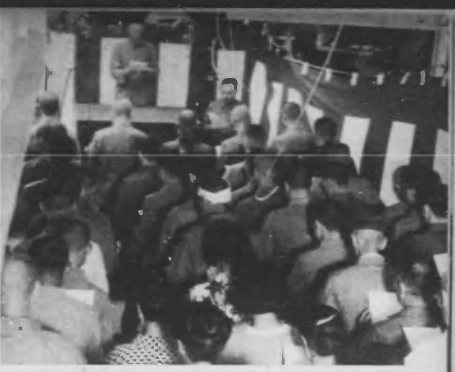
街の講堂。北區南同心町三丁目の町會は街の講堂を講堂で仕切つて町會の屯所を設け毎月一日、全町員を集め、伊勢神宮並びに官城の進拜式、教育勸告の傳讀を行つてゐる。

品の賣却代金、その他節約による餘金を以て、兵隊を救済し、また國防兵隊に於ける三、報國貯蓄の徹底的普及、倍加に努めて、これにより愛國公債、貯蓄債券を購入する。實施項目一、生活刷新 生活の無駄排除、簡素生活の樹立、隣保團結の強化。二、消費節約 物資の節約、廢品不用品の活用貯蓄及救済の勵行。三、心身鍛練、健康生活 體位向上、勤勞奉仕。支那事變中、但第一期を三ヶ月間とし、自十三年八月十五日、至同年十一月十四日、第二期以降の實施に付ては追て發表