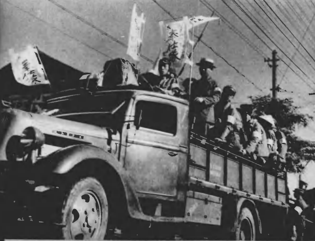
お隣り神戸市が未曾有の水害に襲はれた時隣保相扶の精神で大阪の各町會は起つた。手携當にシヤベル、トラクタまで持参した感身的な復興奉仕に神戸市民を深く感激させた。撮影 大阪市