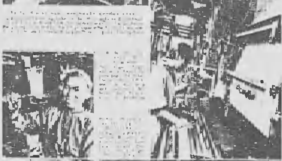
イギリスの工場（日本の戦時工業の模倣）