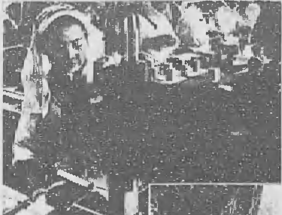
ドイツの工場（日本の戦時工業の模倣）